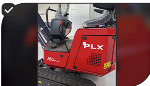
Trava de segurança