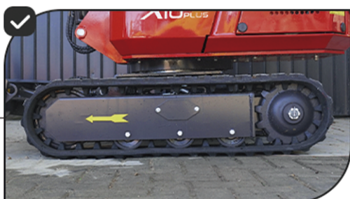
Três roletes na esteira