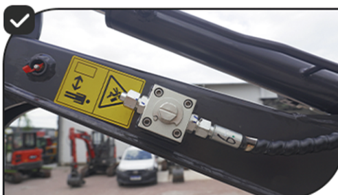
Válvula hidráulica PTO