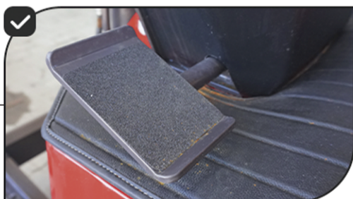
Acionamento PTO por pedal