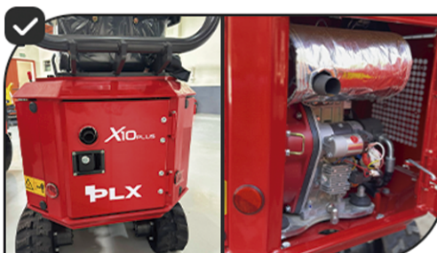
Porta de fácil acesso na traseira