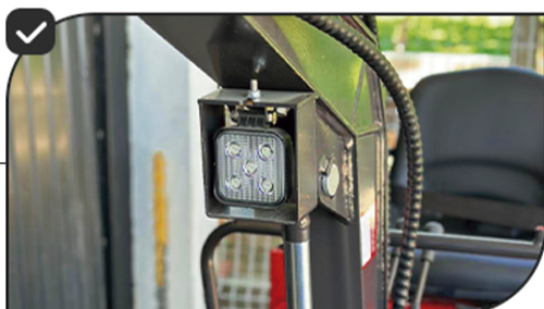
Farol direcional iluminando a concha